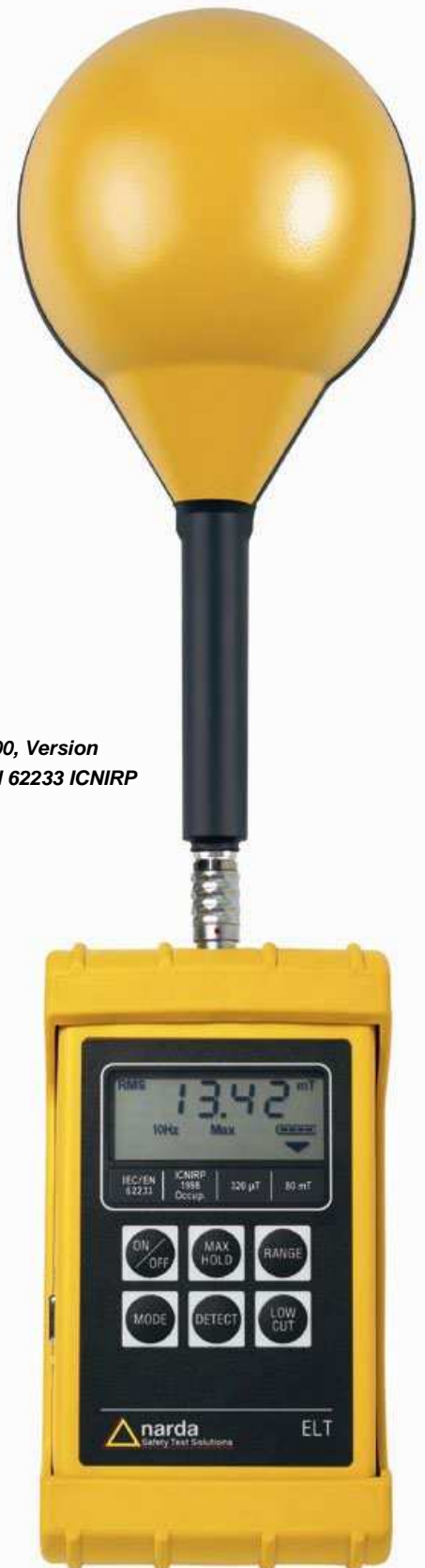
ELT-400, Version IEC/EN 62233 ICNIRP

Die neue EN 62233 [2] ist gewissermaßen eine Rückübersetzung der IEC 62233. Sie wurde von CENELEC am 1. Dezember 2007 angenommen und ersetzt die EN 50366:2003 + A1:2006. Bis zum 1. Dezember 2008 mussten alle EU-Mitgliedstaaten diese Europäische Norm durch Veröffentlichung einer identischen nationalen Norm oder durch Anerkennung übernehmen. In Deutschland entstand so die DIN EN 62233 (VDE 0700-366) [3] mit dem Titel „Verfahren zur Messung der elektromagnetischen Felder von Haushaltsgeräten and ähnlichen Elektrogeräten im Hinblick auf die Sicherheit von Personen in elektromagnetischen Feldern“. Bis zum 1. Dezember 2012 müssen alle nationalen Normen, die der EN entgegenstehen, zurückgezogen werden.